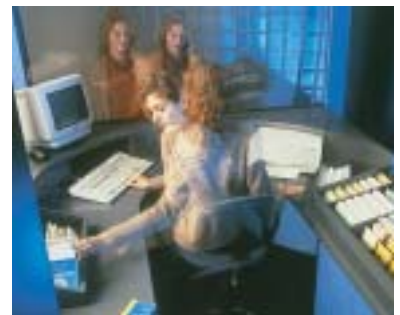
Veel theaterkassa's zijn gebaseerd op het ontwerp van de NS-loketten uit het begin van de jaren negentig.

Nieuwsgierig naar het werk van de ergonomen? Kijk op www.intergo.nl .